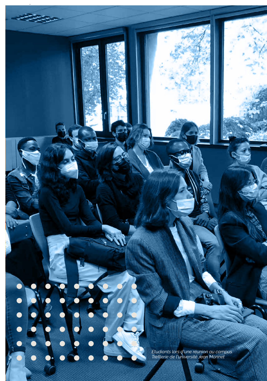
Etudiants lors d'une réunion au campus Tréfilerie de l'université Jean Monnet