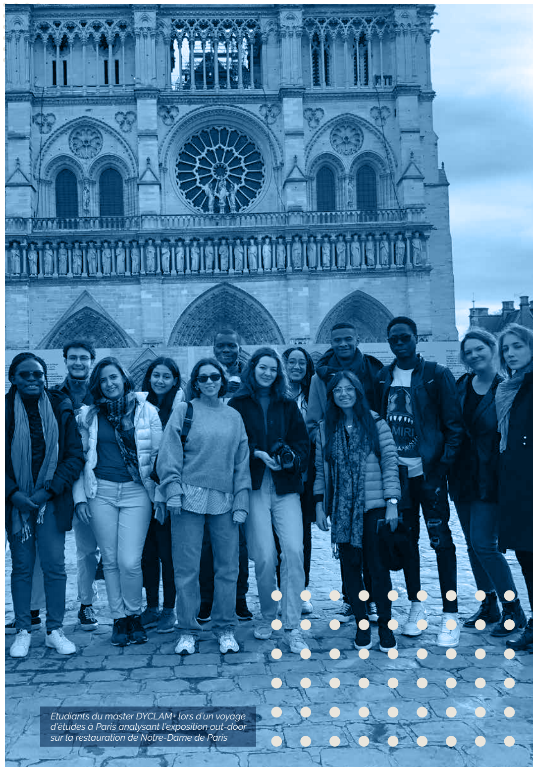
Etudiants du master DYCLAM+ lors d'un voyage d'études à Paris analysant l'exposition out-door sur la restauration de Notre-Dame de Paris